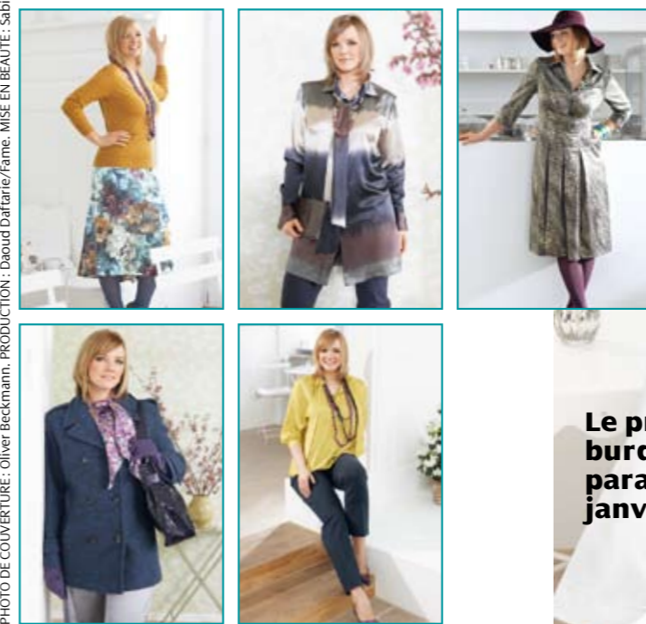
PHOTO DE COUVERTURE : Oliver Beckmann ; PRODUCTION : Daoud Dafarrie/Fame ; MISE EN BEAUTÉ : Sabine Oberhuber

Le prochain burda mode Plus paraîtra en janvier 2009