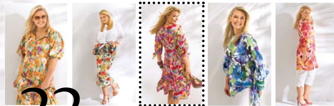
Notre couverture !