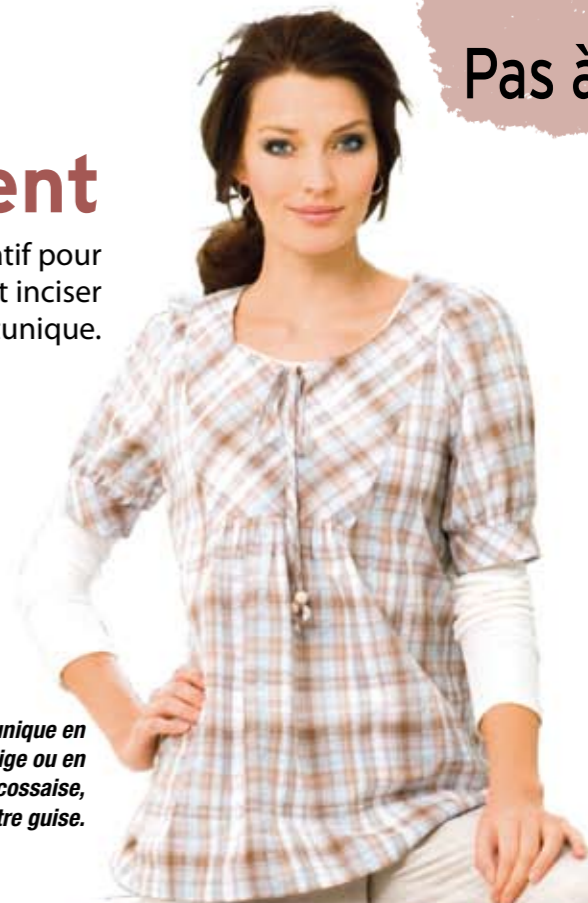
Tunique en lin beige ou en version écossaise, à votre guise.

1 Piquer l'empiècement sur le devant. Piquer du repère A jusqu'au repère B, cranter la couture dans l'angle au niveau du repère B.