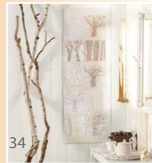
34 Forêt sous la neige Arbres figés et flocons enneigés composent une forêt féérique à imaginer bloc après bloc !