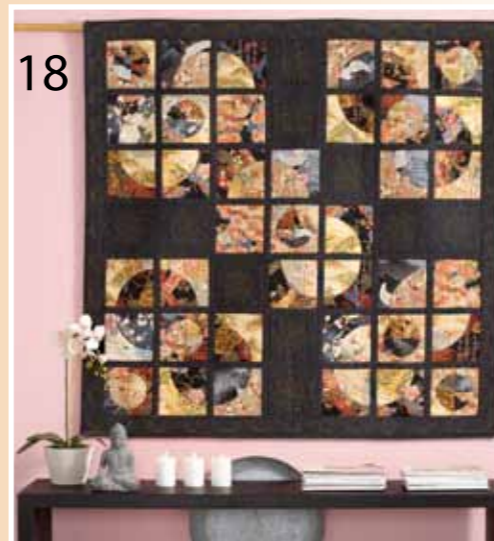
18 Clair de lune Obscure ou lumineuse, la lune offre un captivant spectacle à qui la regarde par la fenêtre !