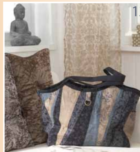
12 Sac et sa pochette En dedans du sac élégant, une pochette qui l'est tout autant sait se montrer indépendante.